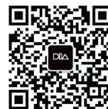
官方微信二维码 Official WeChat QR Code