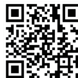
官网二维码 Official website QR code

Organizer: Design Intelligence Award Committee